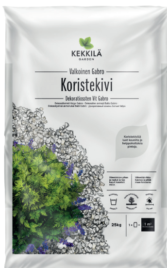
Pakkauskoost 25 KG

Kivisäkiässä on irtonaista kivipölyä, joka saattaa värjätä. Suosittelemme kivien pesua ennen aroille pinnoille levittämistä tai suojaamaan arat pinnat. Värin levitessä pinnat on huuhdeltava välittömästi.