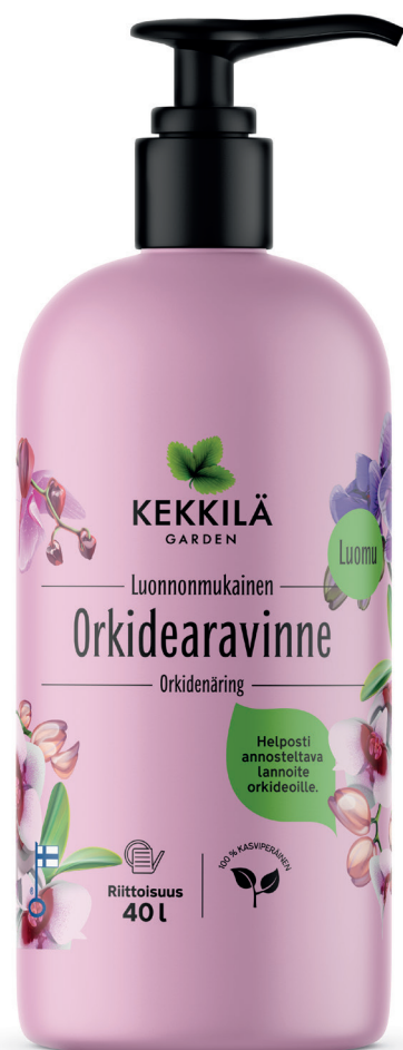
Pakkauskoost 400 ML