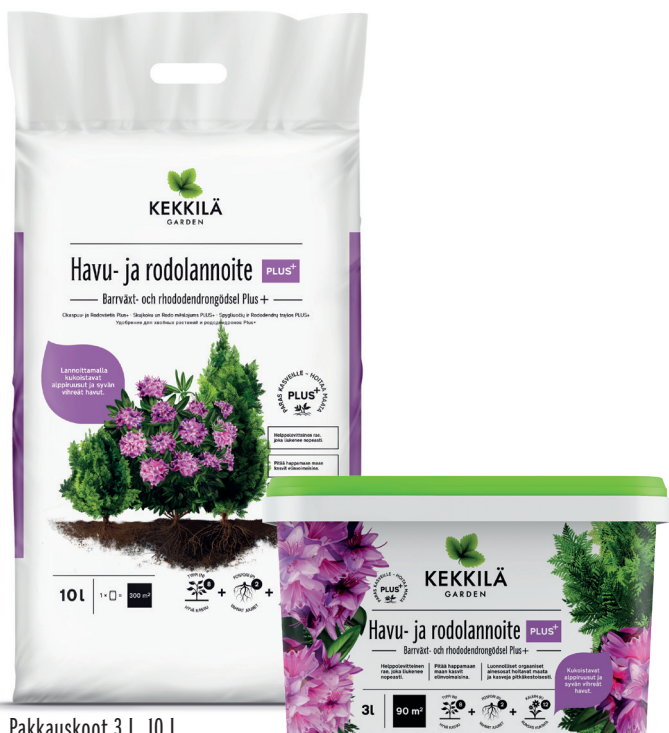
Pakkaukset 3 L, 10 L